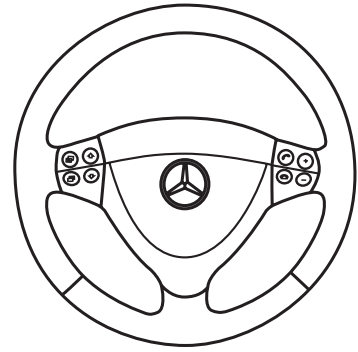
ステアリングリモコン操作可能

※音量調整・選曲など一部機能が操作できます。 ※対応機種はCANバスアダプターPLUSの詳細情報をご確認ください。