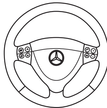
ステアリングリモコン操作可能

※音量調整・選曲など一部機能が操作できます。 ※対応機種は CAN バスアダプター PLUS の 詳細情報をご覧ください。